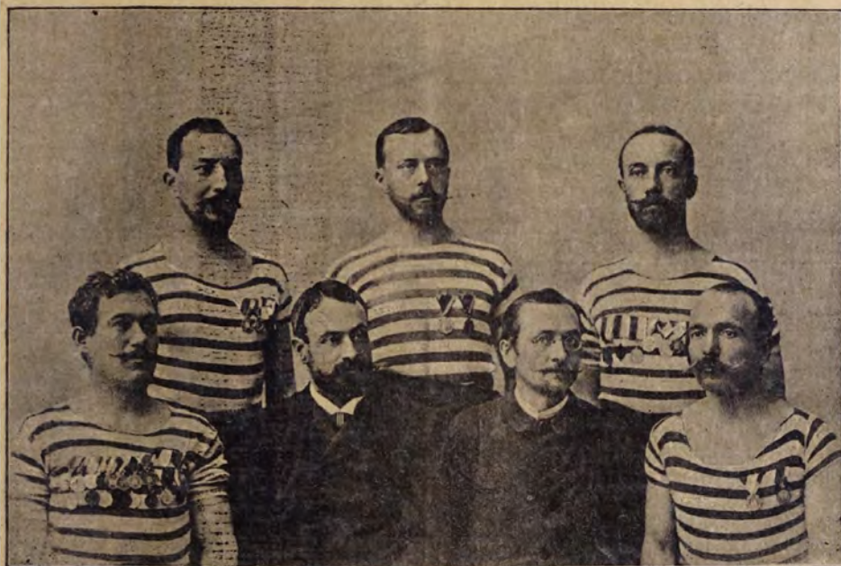
Arczképek a kološvári athletikai clubból

A lövészet sorrendje: Május hó 1-én, vasárnap, reggel 8 órakor a lövészet megkezdése, mely 6 tarack-lövessel jeleztetik. A lövészet tart déli 1 óráig, ekkor társasbéd. Délután 2 órakor a lövészet folytatása alkonyá-