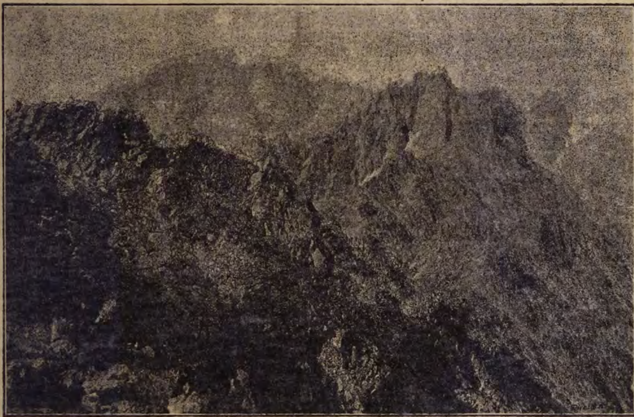
Közel az éghez.

— No, ne roskadjon össze. Talán bepálinkázott? Álljon egyenesen. Nem lesz magának baja. Csak a fiát — vagy