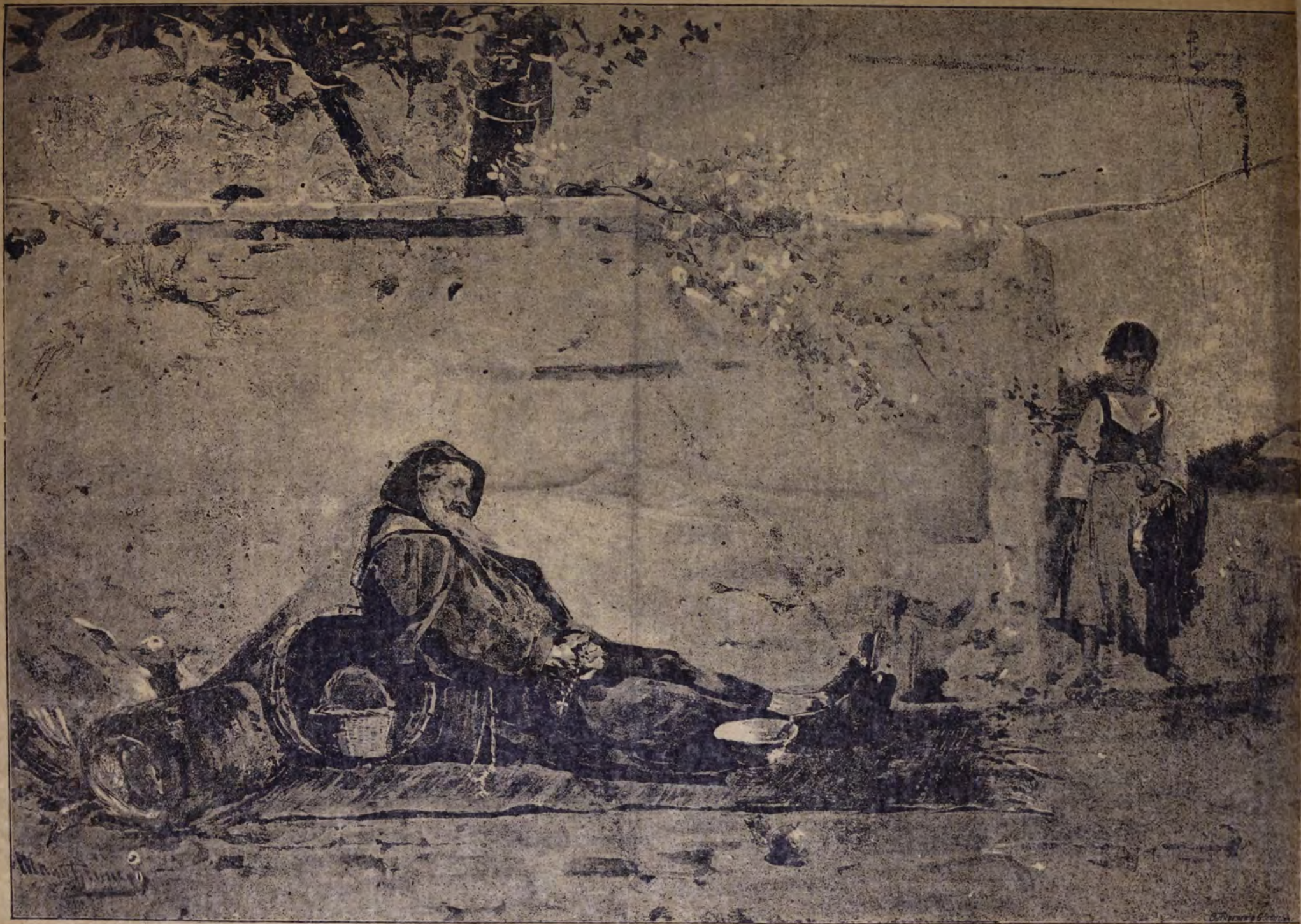
A haldokló zarándok. Mannheimer rajza.