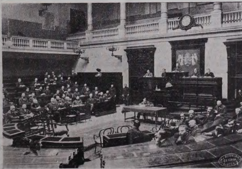
Az első Magyar Országos Testnevelési Kongresszus ülése a régi képviselőházban.

= A Törekvés megóvatolta a BTC-vel tartott őszi mérkőzését.