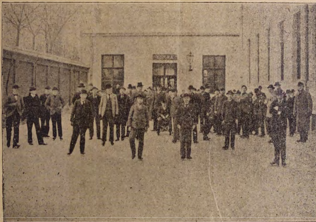
Tornázás télen a debreczeni kereskedelmi akadémiában.

Országszerte foglalkoznak, a középiskolai tanulóifjúság, testi nevelésével, a tornatanítás reformjával, s e nagy fontosságú kérdésekhez egyaránt hozzászólnak gyakorlati szakferfiak és tudományos elméleti érdeklődők. Egész kis irodalmat állíthatnánk össze azon eszmékben gazdag fejtegetésekből, melyek csak a tavaly Havre-ban tartott nemzetközi kongresszus óta a legutóbb lezajlott költségvetési vitánkig kerültek nyilvánosságra s miknek legtöbbször a nevelés terén bő tapasztalattal bíró egyéniség kiváló becsü nyilatkozata. Valamennyi azonban oda concludál, hogy a mennyire csak lehet megszorítsuk a szer tornázást és helyette a test szabadabb mozgását megengedő, szabad levegőben végezhető atletikai gyakorlatok, a futás, ugrás, uszás, korcsolyázás s a külön-