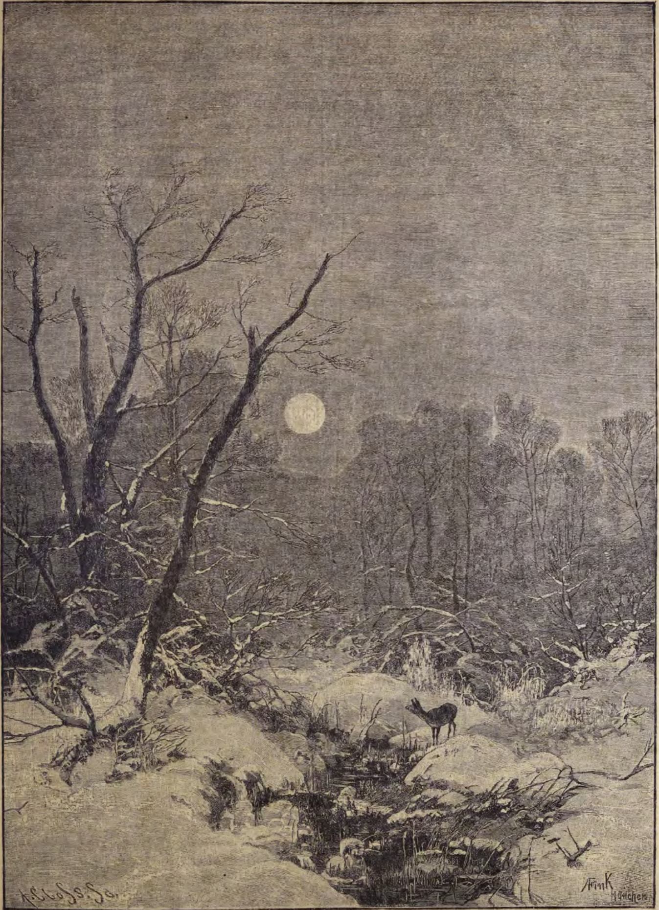
Sportkepek : I. Vadasz-hangulat. (Fink A, festménye.)