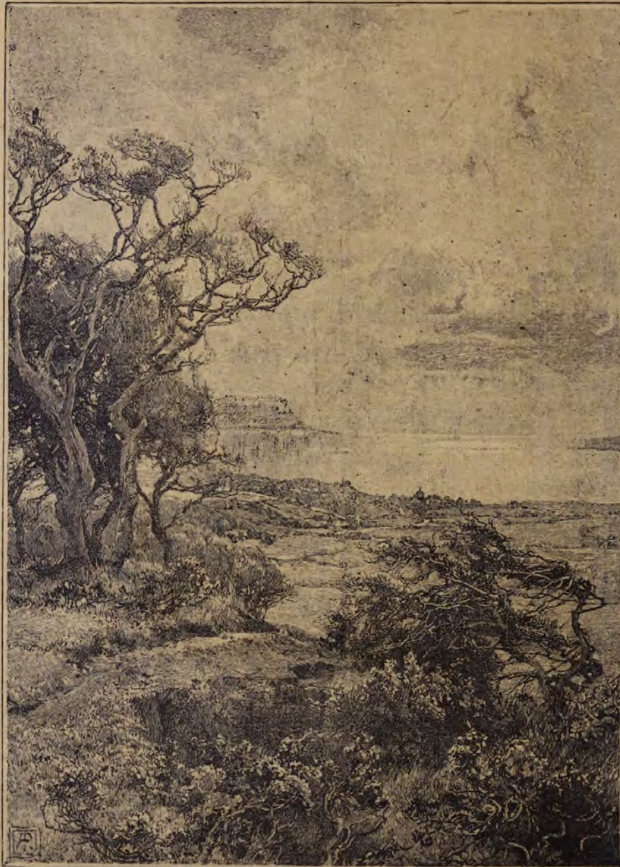
Turista-sport a Balaton vidékén.

a turisták figyelmét. A Balaton somogyi partja homok buczkáiival nem nagy változatossággal kínálkozik ugyan, de annál szebb az északi oldal, mely a Kisfaludy által oly szépen megénekelt tájakat zárja magába. A turista Keszthely vidékétől egészen Balatonfüredig gyönyörű tájakon gyalogolhat s egy kis izelítőül képen is bemutatjuk a Keszthelyfenéki tájat kilátással a Badacsony felé. Nem kételkedünk benne, hogy turistáink most szezonzukban fel fogják keresni a magyar tenger szép partvidékeit.