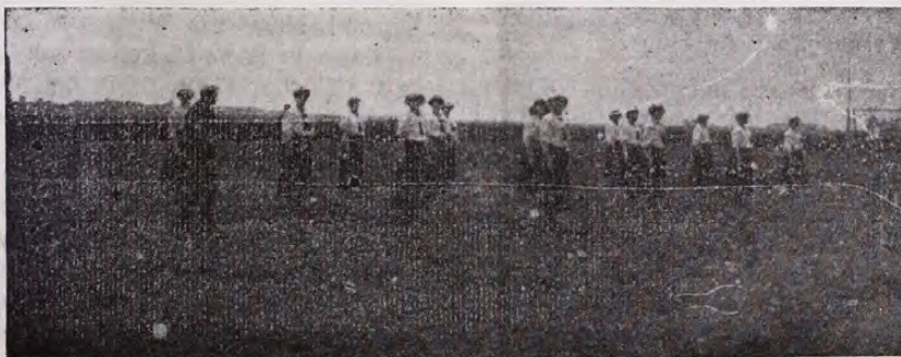
A MOTESz székesfehérvári tornaünnepén résztvevő Postás-hölgyecsapat a Toldi-emlékversenyben.

nem lehettek! Tud a és érezte ezt a MUSz hivatalos képviselője is, aki a versenybíróssággal egyetemben hozzájárult ahhoz, hogy a versenyzők a dressz használatát melőzhessék. De közelebbi esetben sem tehetek volna — kevés kivétellel — mást, mert a MUSz az új szabályokkal kapcsolatosan elfelejtett