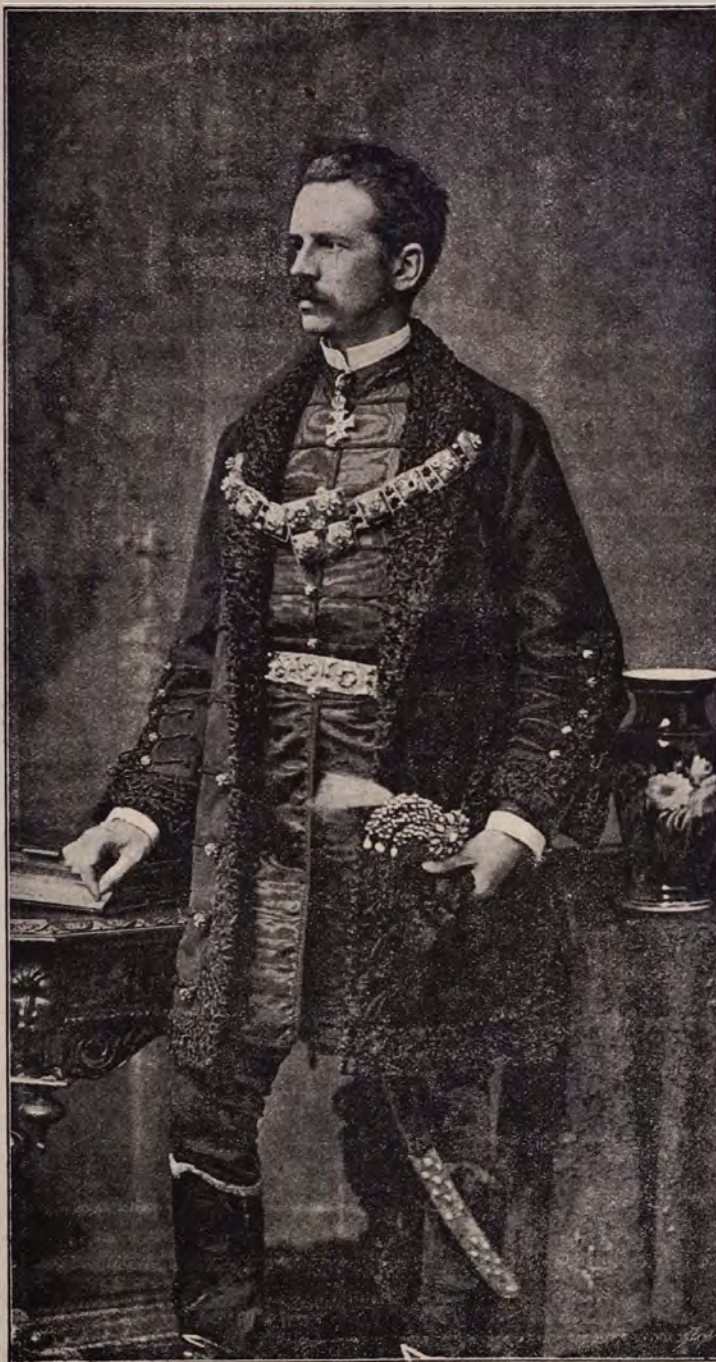
Csáky Albin gróf.

Nagy előnye e módnak az, hogy teljesen ugyan úgy kell ülni, evezni a csónakban mint a nagy vízben; tehát nemcsak már gyakorlott csónakászok részére jó ez, hanem télen át egy jó erőre találva, azt tavaszra teljesen