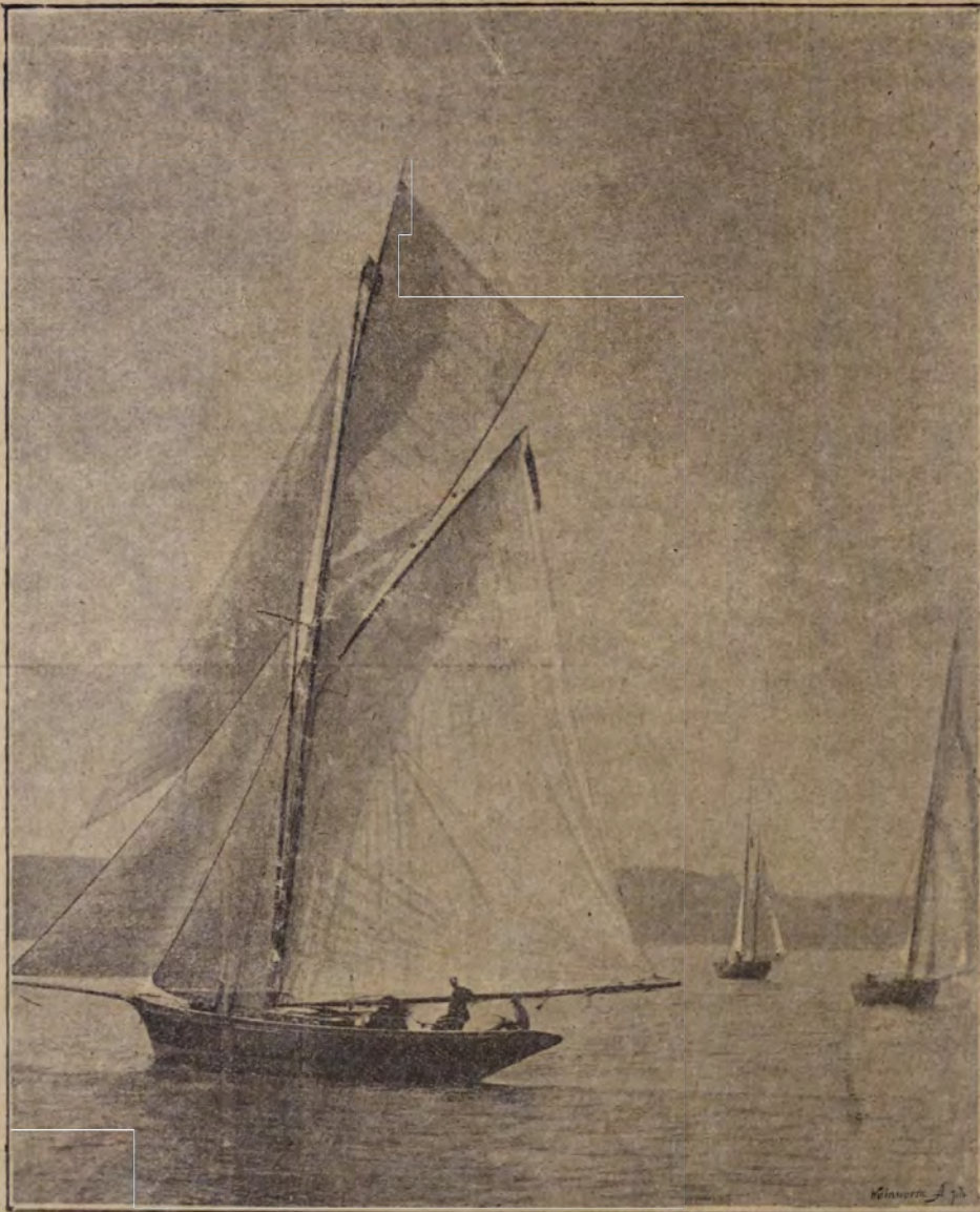
A „Stefánia Yachtclub vitorlásai.