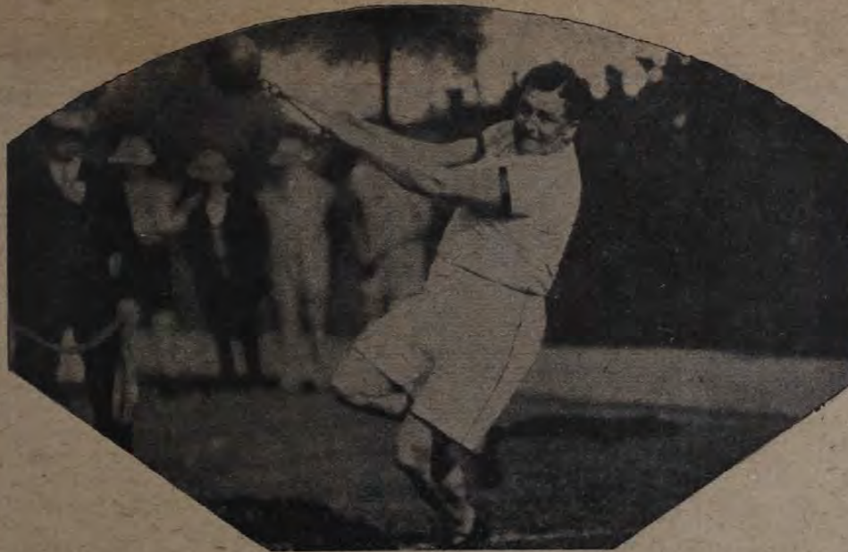
JOHN FLANAGAN (Amerika) világbajnok a kalapácsvetésnél.

A képviselőházban elhangzott két beszéd-től igazán többet vártunk, mert feltételeztük, hogy komoly emberek, komoly helyen nem fogják a hurokat a végletekig feszíteni, hanem rámutatnak az üdvös és szükséges kibontakozás fonalára. E helyett azonban elhangzott