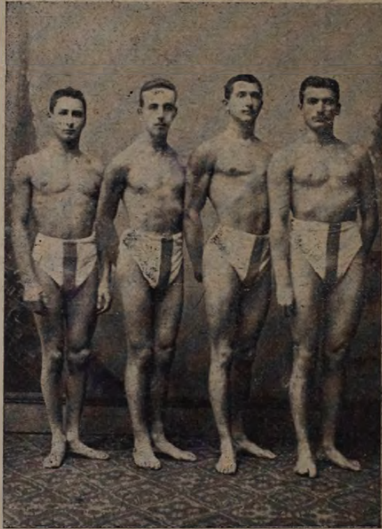
A Ferencvárosi Torna Club staféta-csapat.

A M. L. Sz. megalapítására irányuló mozgalomban, a Sp.-V. is jelentékeny részt vett. Mint a szövetség hivatalos lapja adta ki 1901-ben saját költségén a szövetség által elfogadott első alap- és játékszabályokat és döntvényeket, valamint azok későbbi módosítását. Ez évben indultak meg a M. L. Sz. bajnoki mérkőzései is. Az első évi I-ső oszt.