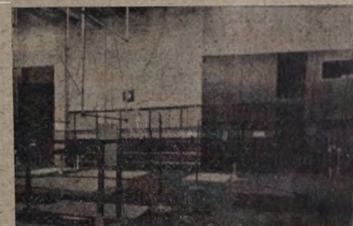
A »Missouri Athletic Club« (St. Louis) belső berendezése.

zett egy versenyt, amelyen a négyes számot — Vác város díja, — a szentendreiekkkel szemben a vácziak nyerték meg. Az alábbi táblázat áttekinthető képét nyújtja az 1906. versenyeredményeknek.