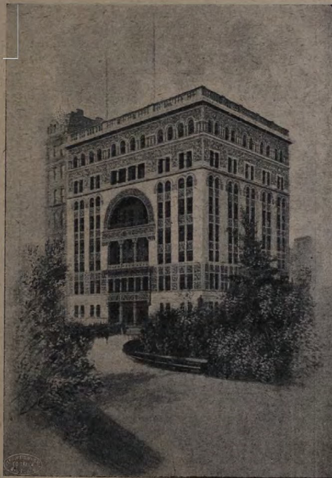
»New-York Athletic Club« háza (Central Park South and Sixt Avenue).

A kerületi bajnokságok rendezése kemény dió. Ezt el kell ismernünk. De itt is lehetne olyan módozatokat találni, a melyek ezt az ügyet előre és a biztos siker felé viszik. Mit