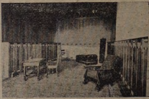
A »Missouri Athletic Club« (St.-Louis) belső berendezése.

letes eredménnyel koszoruzott működés. Hogy ki mindenki járt és győzött Athénben, ma rekapitulálnom felesleges, hiszen azt ugyis regisztrálták Pesten. Így mellőzöm az athéni dolgokat és az egyes sportágak nevezetes eseményeit foglalom röviden össze.