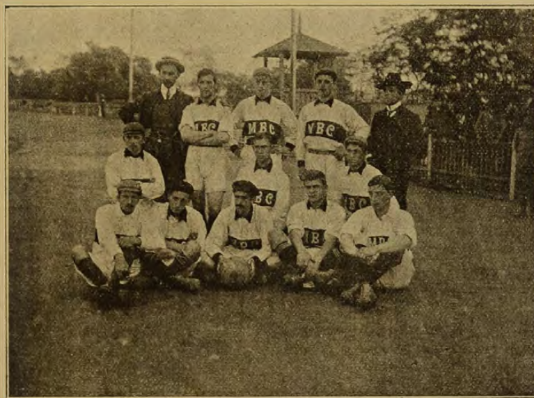
A Mittweidaer Ballspiel-Club csapata.