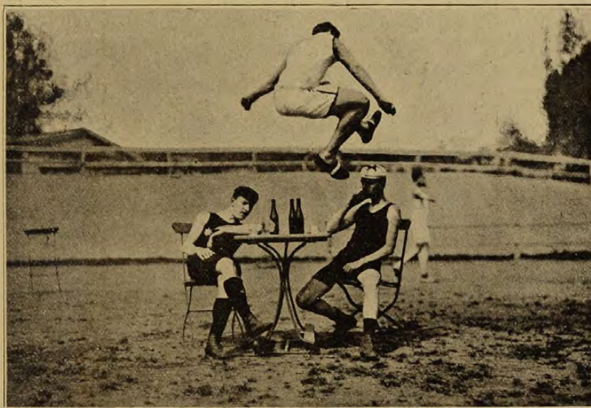
Egy érdekes magasugrás.

Az első őszi nemzetközi rendes jellegű football-matchet a F. T. C. csapata vívta ki mult vasárnapon a Cricketerekkel. A F. T. C.-nak ez volt első komolyabb matche, melyen derekasan kitett magáért.