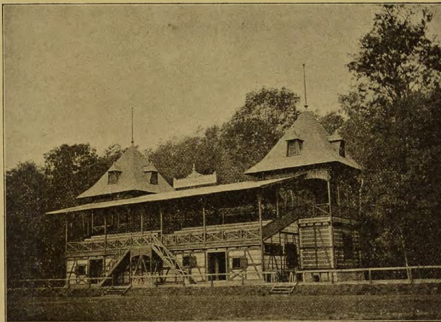
A Pozsonyi Torna-Egyesület sporttelepe.

tendenciám: lovagiasság, meg nem alkuvas a sportban.