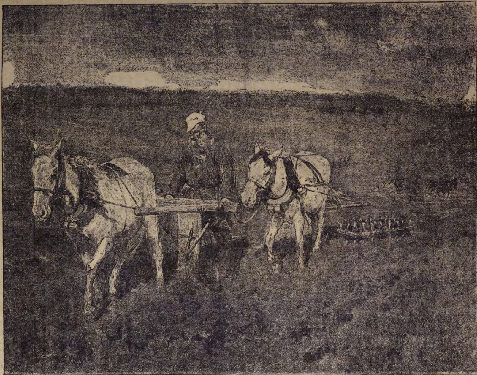
Tolsztoj Leo gróf mint szántóvető.