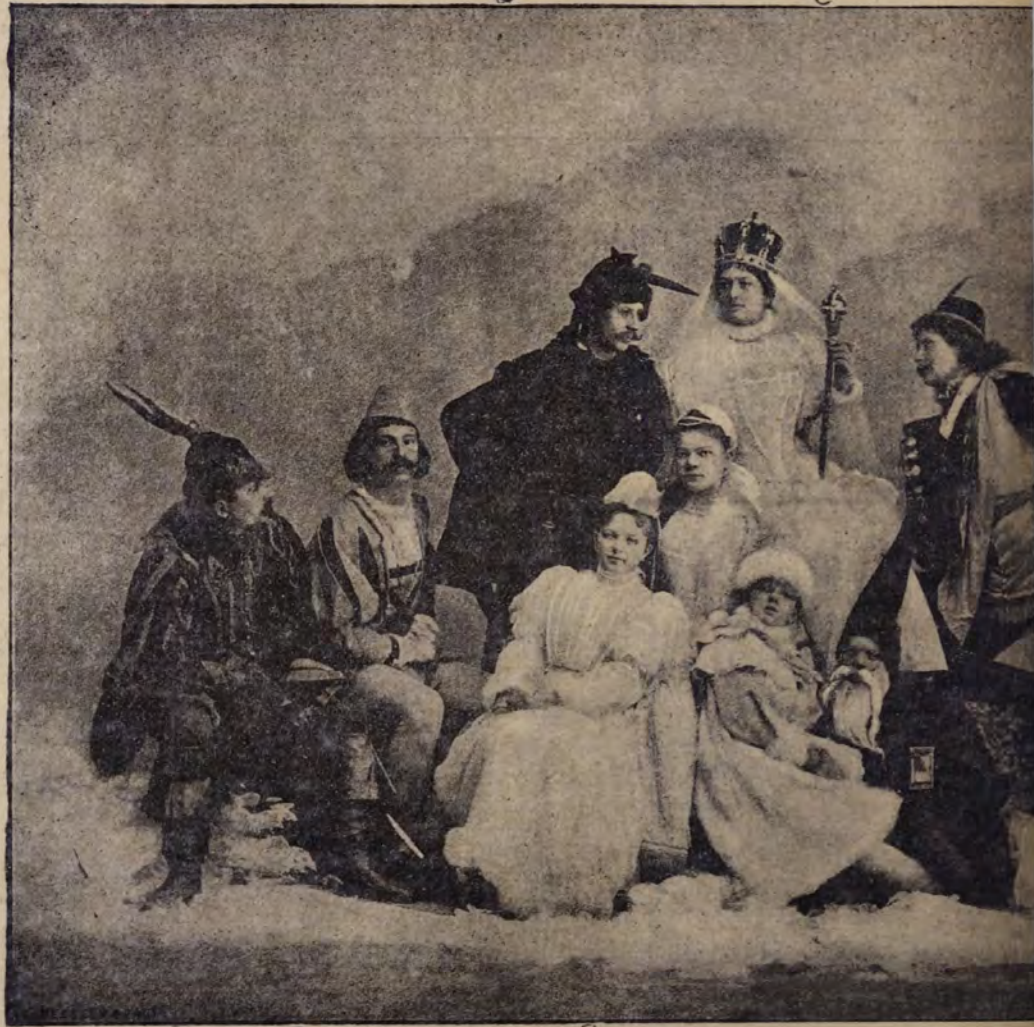
CSOPORTKÉP A VÁROSI

A most alkalmazásban levő tornatanárok nagyrésze ugyanis kisebb fokú képesítésénél fogva nem remélheti, hogy a középiskolai más tanárok fizetését elnyerhesse. Mig az ezután kinevezendők, ha a tornát mint fő vagy melléktárgyat tanítják a rendes tárgyak mellett, kívánhat-