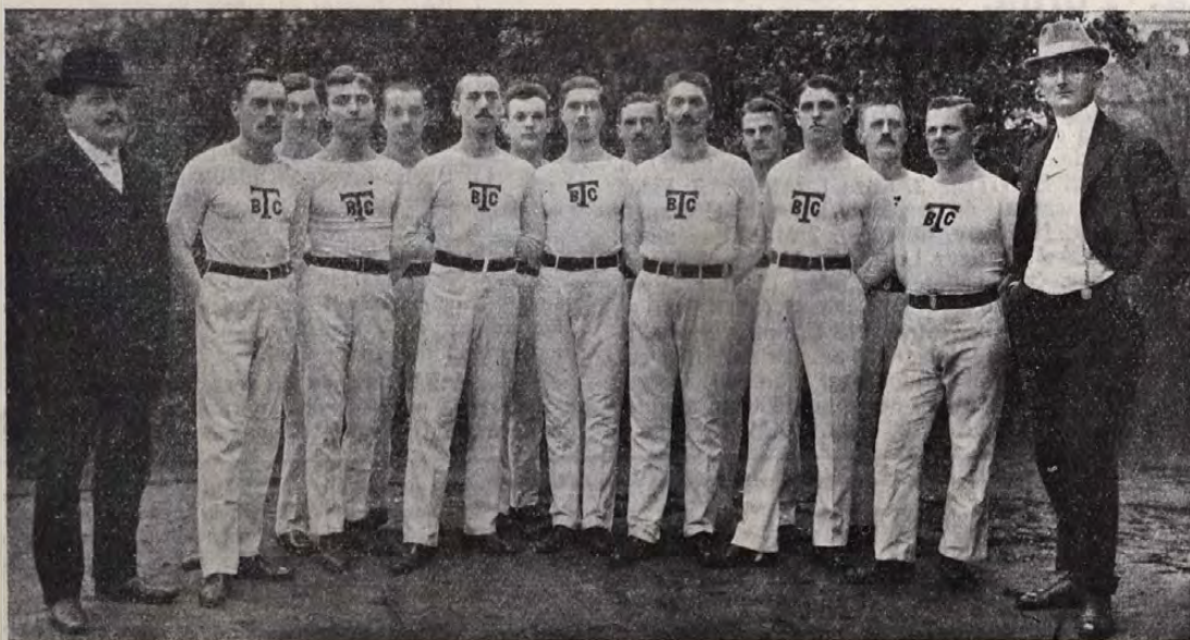
A torinói versenyekre induló két tornászcsapatunk, BTC és OTE